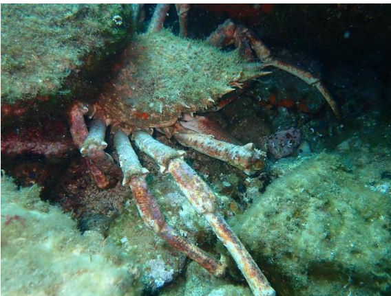
Araignée de mer